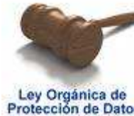
Ley Orgánica de Protección de Datos